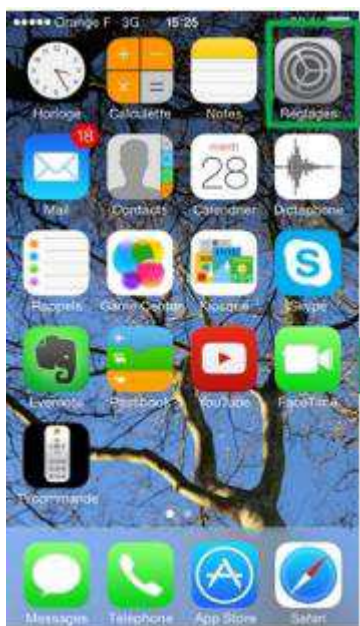
menu « Réglages »

A défaut de désactivation, l'Équipement ne pourra être repris par Orange Business Services.