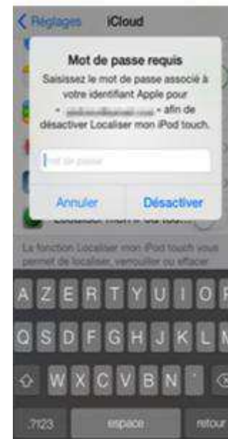
indiquez le mot de passe Apple