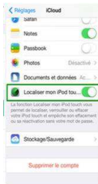
décochez la fonction « Localiser »